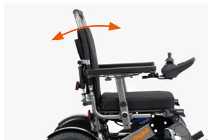
Stufenlos verstellbare Rückenlehne