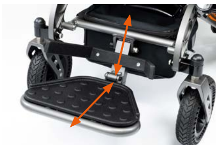
Höhen- und längenverstellbares Fußbrett