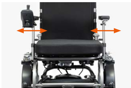
...und Breite verstellbare Armlehnen