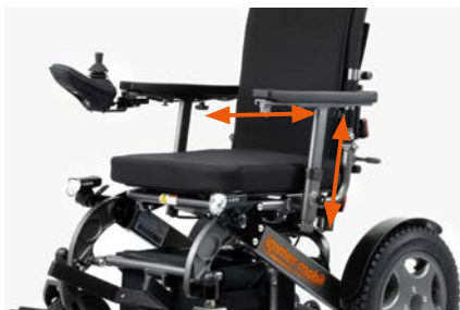
In der Höhe, Länge...