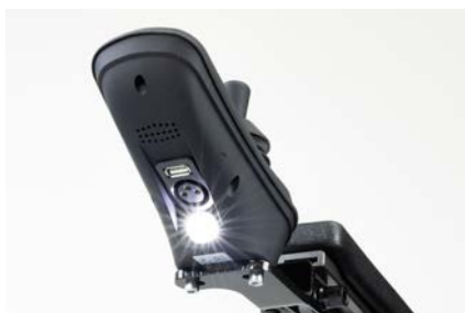
Fahrpult mit integrierter LED-Beleuchtung, USB-Anschluss und Sprachwiedergabe