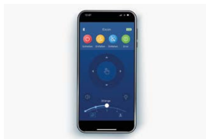
Steuerbar über App mit dem Smartphone

* Reichweite bei maximaler Anzahl der Batterien. Siehe Technische Daten.